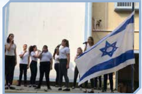
להקת בית הספר הניהול מקבוצי