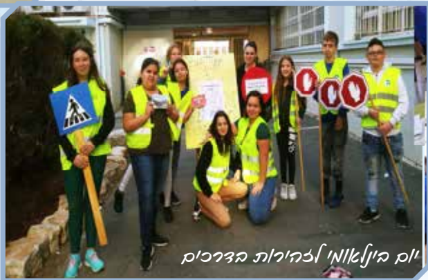
יוק ה'ינאטאוי אב'הירות הצרכ'וק