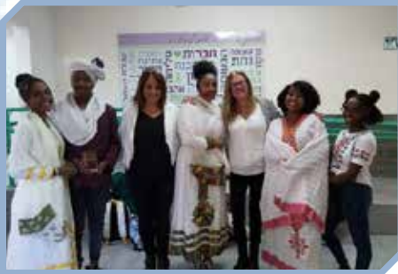
חגיגות חג הסוכות