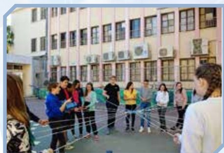
אוליום וימי ג'ובא