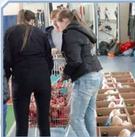
פעילות התנדבותית אריזת חבילות אנצקקים