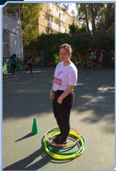
יוק האצט'ס הטאב'יק יוק ספארט הבו"ס צרור