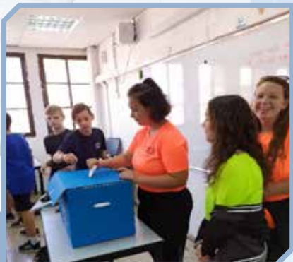
ב'חירות אמוצ'ת תא'וד'ים 2019