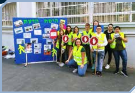
יום זהירות בדרכים בסיון "היסוך הדעה"